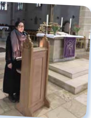
In der Orgelmusik zur Marktzeit – Poetry Slam