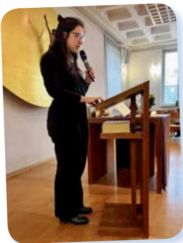
Im Kairos-Gottesdienst – 7 Wochen ohne Verzagtheit: „Meine Ängste“